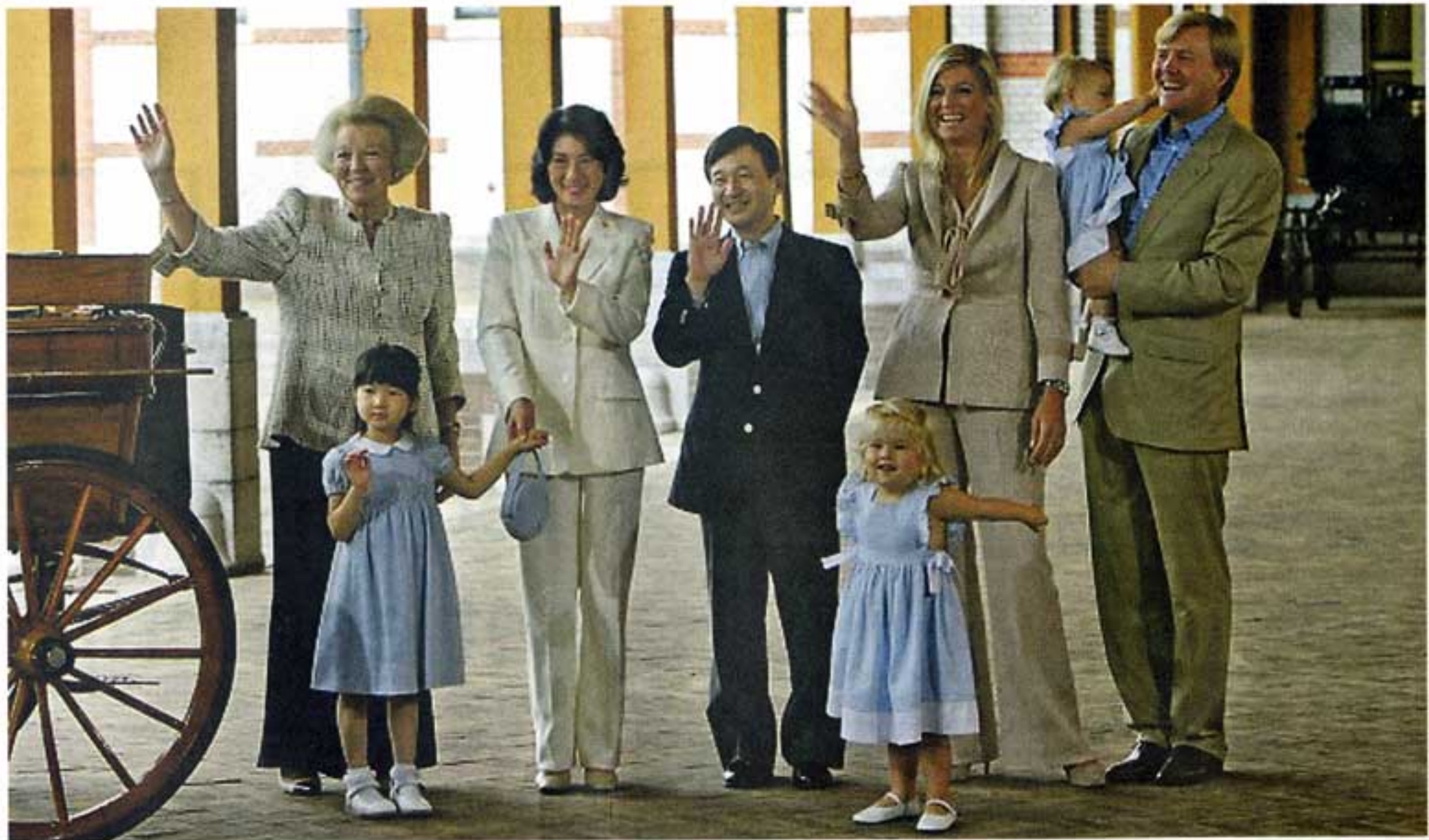
Koningin en troonopvolgers in Apeldoorn: vlnr. Beatrix, Masako met Aiko, Naruhito, Máxima met Amalia, Willem-Alexander met Alexia.