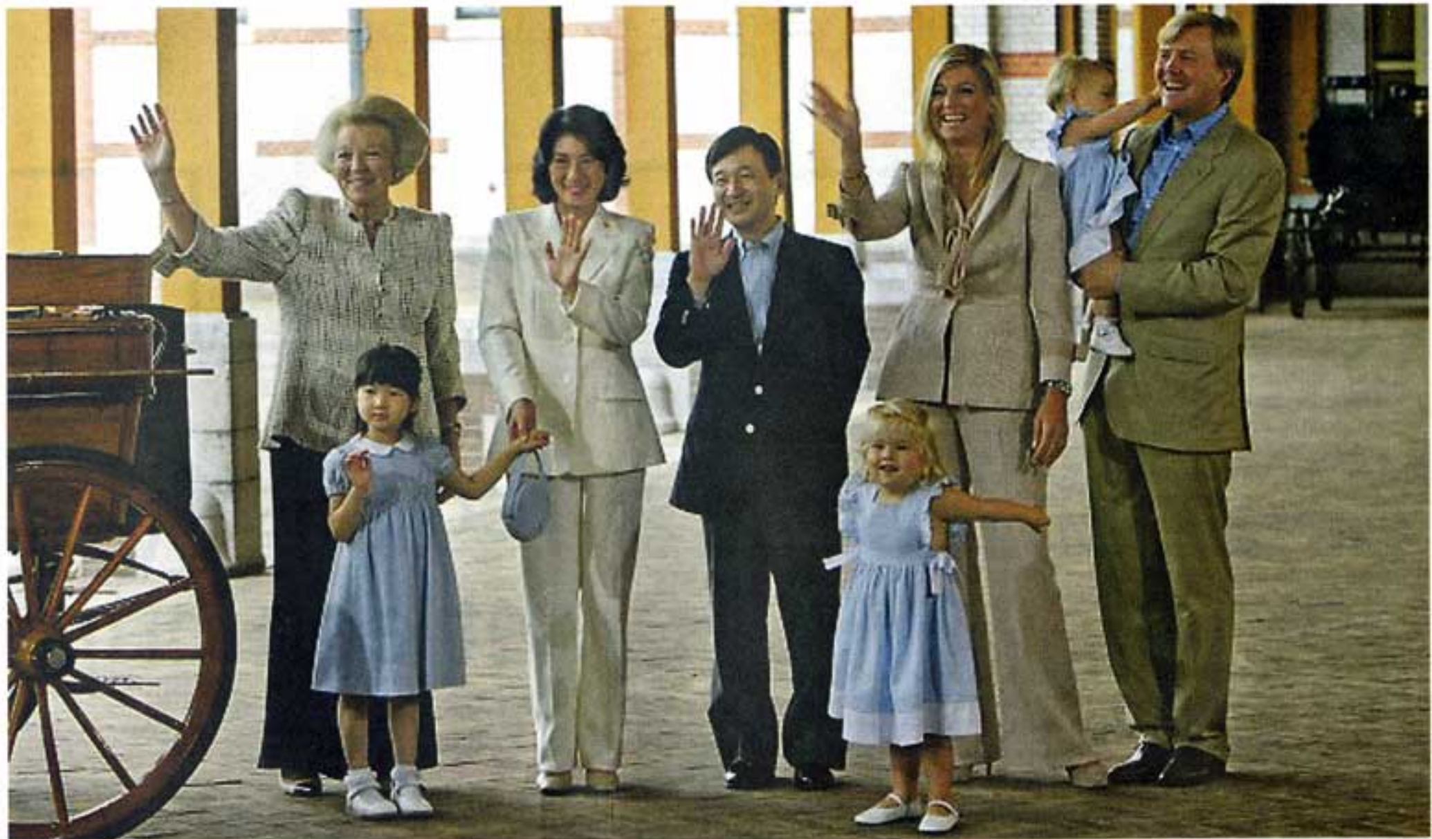
Koningin en troonopvolgers in Apeldoorn: vlnr. Beatrix, Masako met Aiko, Naruhito, Máxima met Amalia, Willem-Alexander met Alexia.